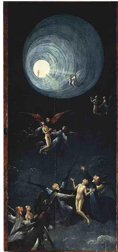
(Opstijging naar de Hemel, Jeroen Bosch)

Ik probeer een beetje de Nederlandse literatuur bij te houden door boeken te lezen die geschreven zijn door auteurs als J. Bernlef, Harry Mulisch, Jan Siebelink. Momenteel ben ik bezig in 'de onderwaterzwemmer' van P.F. Thomése. Daarnaast ben ik aangesloten bij een leesclub, die wordt georganiseerd door een samenwerking tussen Stichting Senia en BplusC Leiden. Het concept is dat je een lijst ontvangt waar een stuk of 6 boeken op staan die je moet lezen. Om de 6 weken komt de leesclub bij elkaar en bespreken we een gekozen boek van de lijst. Het laatste boek was 'Buiten is het maandag' van J. Bernlef. Ik ben best tevreden over de leesclub; het is interessant & leerzaam! Verder haal ik ook veel inspiratie uit de media (kranten, tv) en kijk ik graag naar films.